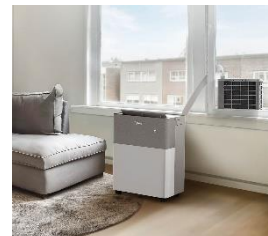
Step 3: In Betrieb nehmen.