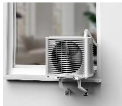
Step 2: Außeneinheit auf die Halterung setzen (Plug&Play).